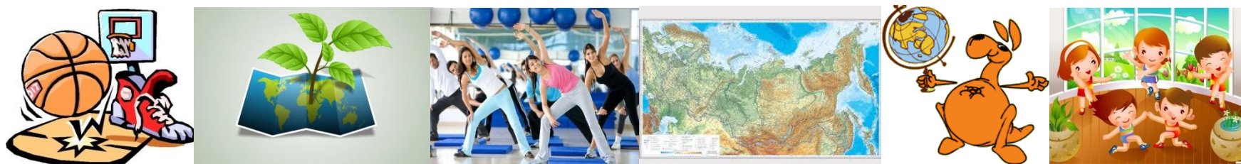
Схема проведения обсуждения интеллектуально-спортивной игры со студентами на занятии